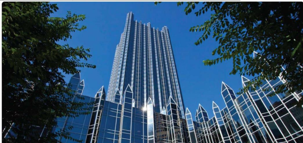
آمریکا - ایالت پنسیلوانیا - پیتسبورگ (برج شرکت صنایع PPG)

تازه‌های شرکت - صفحه (۴) رویدادهای پیش رو - صفحه (۴)