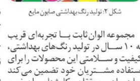
شکل ۲: تولید رنگ بهداشتی صابون مایع

بعضی صابون‌ها که غالباً رنگ‌های خارجی هستند، به دلیل داشتن مواد افزودنی و غیر مجاز باعث تحریک و آسیب‌زدن به پوست مصرف کنندگان خواهند شد و کیفیت محصولات شوینده را به شدت پایین می‌آورند. این در حالی است که رنگ بهداشتی صابون تولید شده در مجموعه الوان ثابت به دلیل استفاده از مواد استاندارد و به صرفه، علاوه بر اقتصادی بودن محصول، امکان ایجاد آسیب‌های پوستی را در مصرف کنندگان به حداقل می‌رساند.